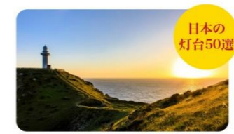
⑥大瀬埼灯台 九州本土でも遅く夕陽が沈む場所。断崖絶壁の上に建つ白亜の灯台。