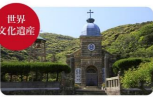
③頭ヶ島天主堂 世界文化遺産に登録された「頭ヶ島の集落」にある石造りの天主堂。

【有川港(新上五島)への交通アクセス】 ●長崎港(長崎市)から有川港まで高速船で1時間43分 ●佐世保港(佐世保市)から有川港まで高速船で1時間25分、フェリーで2時間35分 【福江港(五島)への交通アクセス】 ●長崎港(長崎市)から福江港までジェットフォイルで1時間25分、フェリーで3時間10分