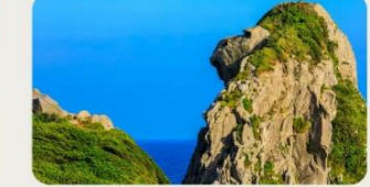
⑦猿岩 自然により造られた猿岩。「そっぽを向いたサル」にそっくり!