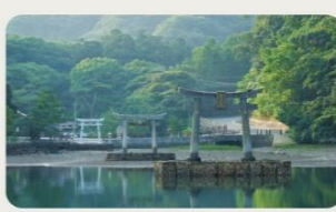
②和多都美神社 彦火火出見尊と豊玉姫命を祭る海宮。竜宮伝説が残されています。

【対馬やまねこ空港(対馬)への交通アクセス】 ●長崎空港(大村市)及び福岡空港(福岡県)から対馬やまねこ空港まで飛行機で35分 【芦辺港(壱岐)への交通アクセス】 ●博多港(福岡県)から芦辺港までジェットフォイルで1時間10分、フェリーで2時間10分