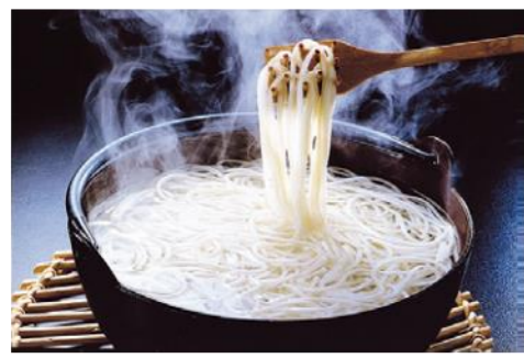
五島手延うどん (五島市、新上五島町) 一説には遣唐使の時代に伝わったとされるうどん。日本三大うどんのひとつに数えられる味わいを、ぜひ。