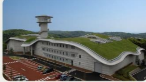
⑥壱岐市立一支国博物館 国指定特別史跡「原の辻遺跡」や島内の出土品を展示。