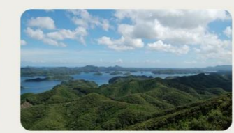
③烏帽子岳展望台 標高176mの烏帽子岳から、リアス式海岸の景観を一望できます。