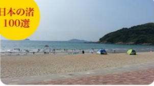
⑦高浜海水浴場 長崎半島の先端に位置するコバルトブルーの美しい遠浅の海。