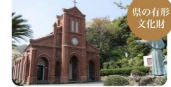
⑧堂崎教会 禁教令廃止後、五島で最初に建てられた天主堂。