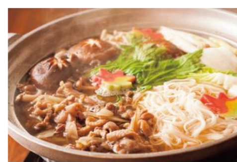
ひきとoshi (壱岐市) 壱岐のおもてなし料理。鶏ガラ出汁のスープに野菜たっぷり、歯ごたえのある壱州豆腐のお鍋は地酒の麦焼酎との相性◎