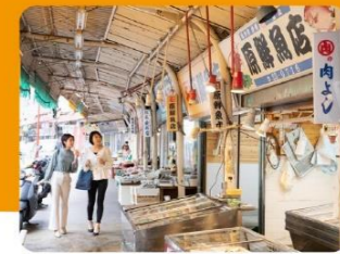
②戸尾市場街・とんねる横丁 とんねる横丁は戦時中の防空壕をそのまま生かして作られた市場で、海産物、青果、日用雑貨等の店が軒を並べています。