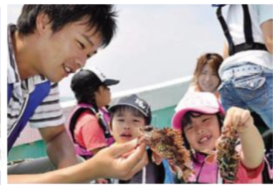
松浦党の里ほんなもん体験 (松浦市)

自然を見るだけじゃもったいないという人は、シーカヤックや九十九島遊覧船など充実したマリンスポーツも。「九十九島水族館海きらら」は、クラゲドームやイルカプールなど見所満載。「九十九島動物園森きらら」もすぐ。