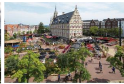
ハウステンボス (佐世保市)

家族みんなで楽しめる花と光の感動リゾート。運河に囲まれたヨーロッパの街並みで癒しの非日常体験を。