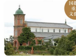
⑥田平天主堂 大正4年から3年の歳月をかけて、信者達の手によって建設されたロマネスク様式の教会。色鮮やかなステンドグラスは、絵画を思わせる美しさです。