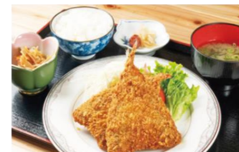
アジフライの聖地松浦 (松浦市)

旨味のある赤身と軽やかな脂身のバランスが絶妙な長崎和牛。中でも、平戸牛は柔らかな肉質が特徴です。