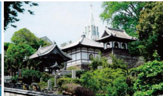
寺院と教会の見える風景 (平戸市)

長崎の出島よりも前に我が国唯一のオランダ貿易港として賑わっていた平戸。1639年当時の建物を忠実に復元した平戸オランダ商館で大航海時代にタイムスリップしよう。