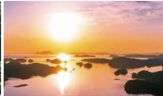
九十九島「船越展望所」 (佐世保市)

カトリック教会の屋根や十字架と、寺院の屋根瓦が重なった風景は、いち早く海外交流の窓口となった平戸ならではの魅力。