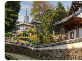
⑧寺院と教会の見える道 「聖フランシスコ・ザビエル記念教会」と、周囲の寺院が織りなす西洋と東洋が融合した空間。異国との交流があった平戸の歴史を感じさせるスポットです。