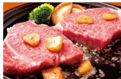
長崎和牛 (平戸市など)

旨味のある赤身と軽やかな脂身のバランスが絶妙な長崎和牛。中でも、平戸牛は柔らかな肉質が特徴です。