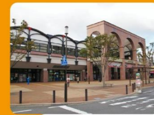
①佐世保駅 JR日本最西端の駅。