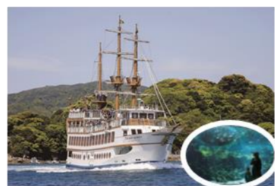
九十九島パールシーリゾート (佐世保市)

208もの島からなる風光明媚な景勝地。「世界で最も美しい湾クラブ」に加盟認定されています。