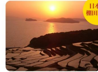
⑩土谷棚田 日本の棚田百選の中でも指折りの棚田と、呼び声も高い土谷棚田。沈む夕陽と鳥影、棚田の美しい瞬間を捉えるため、全国から多くの写真家が撮影に訪れます。