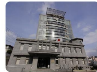
④海上自衛隊佐世保史料館「セイルタワー」 明治31年に海軍士官の集会所として建築された佐世保水交社の一部を修復・増設した艦艇史料館。旧海軍及び海上自衛隊の歴史や活動を解説しています。