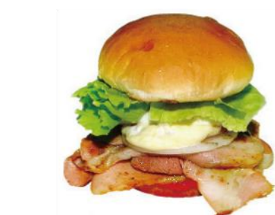
佐世保バーガー (佐世保市)

家族みんなで楽しめる花と光の感動リゾート。運河に囲まれたヨーロッパの街並みで癒しの非日常体験を。