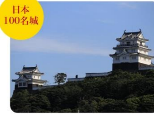
⑦平戸城 1718年に完成した平戸城は、2021年の平成の大規模改修にて、外壁内壁の補修及び展示品の完全リニューアルオープン。平戸の歴史をデジタルアートで体感できます。