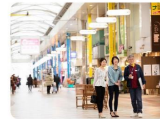
③さるくシティ403アーケード 403とは四ヶ町商店街の4、佐世保玉屋の〇、三ヶ町商店街の3の総称、さるくとは「散歩する」の方言です。全長約1kmあり、一直線のアーケードとしては日本一！