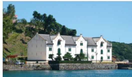
平戸オランダ商館 (平戸市)

長崎の出島よりも前に我が国唯一のオランダ貿易港として賑わっていた平戸。1639年当時の建物を忠実に復元した平戸オランダ商館で大航海時代にタイムスリップしよう。