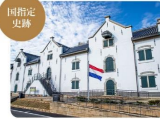
⑨平戸オランダ商館 1641年に出島移転が命じられるまでの33年間続いた、日本唯一のオランダ貿易拠点。「1639年築造倉庫」は2011年に復元し、当時の史料が展示されています。